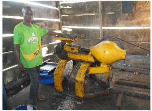
Production huile palmiste et tourteau.

l'alimentation des porcs. Les habitants vendent leur huile palmiste aux fabricants de savon et la quantité de tourteau restante est vendue aux autres éleveurs des porcs. Cette production d'huile