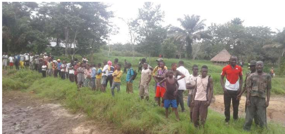
Les villageois suivent attentivement la vidange.

totallement retirés. Les matériaux utilisés ont été : la motopompe pour accélérer l'évacuation de l'eau des étangs, le filet de pêche et épuisette pour la capture rapide des poissons. Malgré que les travaux aient commencé tôt le matin dans le but de terminer avant que la population n'arrive en masse, cela n'a pas été le cas malheureusement. Déjà à 8 h, le site était inondé d'une grande foule de la population qui venait des villages environnants. L'information du déroulement de l'activité de la vidange a circulé très rapidement d'un village à un autre, qu'on ne le croyait pas.