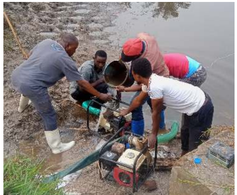
Motopompe à évacuer l'eau de l'étang.

tés du milieu. Le 31 décembre 2019, date de la vidange, à bord d'une moto, nous avons quitté la ville de Kisangani à 5h30 pour Ngene-Ngene afin de participer à la vidange du site pour le compte de l'année 2019. Après 1 heure de route, nous sommes arrivés à 6h30. Nous y avons trouvé les responsables du site et les ouvriers qui y avaient passé nuit. D'autres chercheurs (enseignants) nous ont trouvé sur le site pour participer à ladite activité et aussi pour se procurer des poissons sur place. Les travaux ont commencé à 3 h du matin dans le but d'en finir le plus vite et éviter que la population n'envahisse les étangs avant que les poissons n'y soient