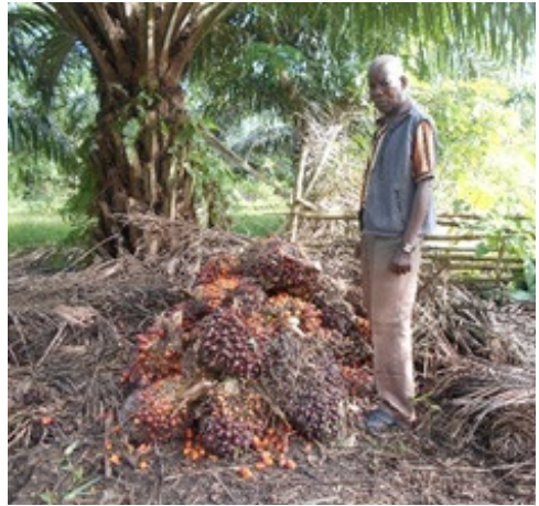
Régimes avec noix de palme

La mesure considérée de la quantité d'huile est le bidon de 25 litres (communément appelé Oki). Les consommateurs témoignent toujours de la bonne qualité de cette huile produite à Batiamaduka.