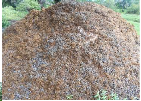
Tas de noix de palme.

puits d'eau afin de pallier aux difficultés liées à l'eau, éprouvées au paravent par les habitants.