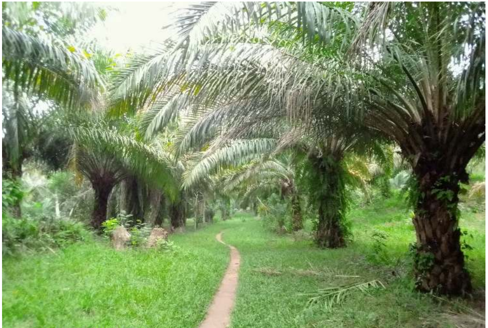
Palmeraie de Batiamaduka.

nera vurensis fournie par l'INERA Yangambi mais on y retrouve aussi l'espèce Tenera piscifera . Au sein de cette palmeraie, une presse à huile y a été installée, pour permettre la production d'huile de palme sur place.