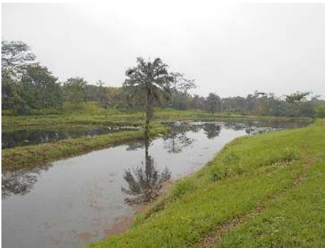
Etang à Ngene Ngene.

due à bas prix et autres services scolaires, mais également à tra-