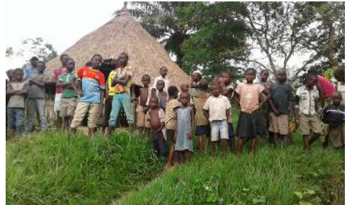
Enfants du village.

vers des multiples vulgarisations dont elle fait l'objet. Dans le cas du site de Ngene Ngene, notons que les habitants de plusieurs villages environnants sont les bénéficiaires directs des activités qui s'y déroulent.