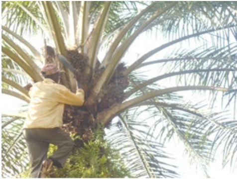
Récoltes des régimes.

Le projet (l'Asbl Kisangani Développement) par son secteur Batiamaduka milite pour la production d'huile de manière régulière. Mais les aléas climatiques font que cette production ne soit pas totalement régulière car les pieds ne fleurissent pas tous à la même période.