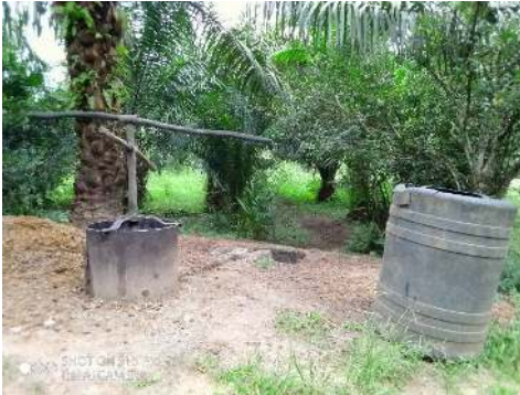
Presse à huile.

installer la presse d'huile. L'objectif assigné à cette dernière, était de presser l'huile des noix de palmes coupés dans cette palmeraie et cela pour s'épargner de payer le droit d'usage au propriétaire lorsqu'on pouvait aller presser ailleurs. Notons que la presse à huile installée au sein de la palmeraie rend un grand service aux